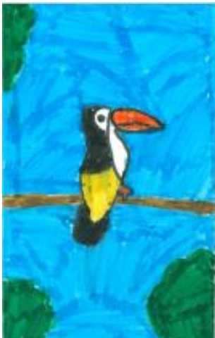
Getekend door Guus van der Burg

we hebben geleerd over de kenmerken van zoogdieren, vogels, reptielen, amfibieën, en vissen. we hebben kleine tekeningen gemaakt van dieren. we hebben het gehad over een zebra. we hebben over de teek gehad maar dat was een beetje vies. En we hadden ook over natuur gehad. we hebben ook naud gehad over dieren. Guus en Thomas J.